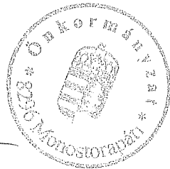
Takács Péter polgármester

Takács Péter polgármester békés, áldott ünnepeket és eredményekben gazdag új évet kívánt a képviselő-testületek tagjainak, majd további hozzászólás hiányában megköszönte a részvételt és az ülést 18:17 órakor bezárta.